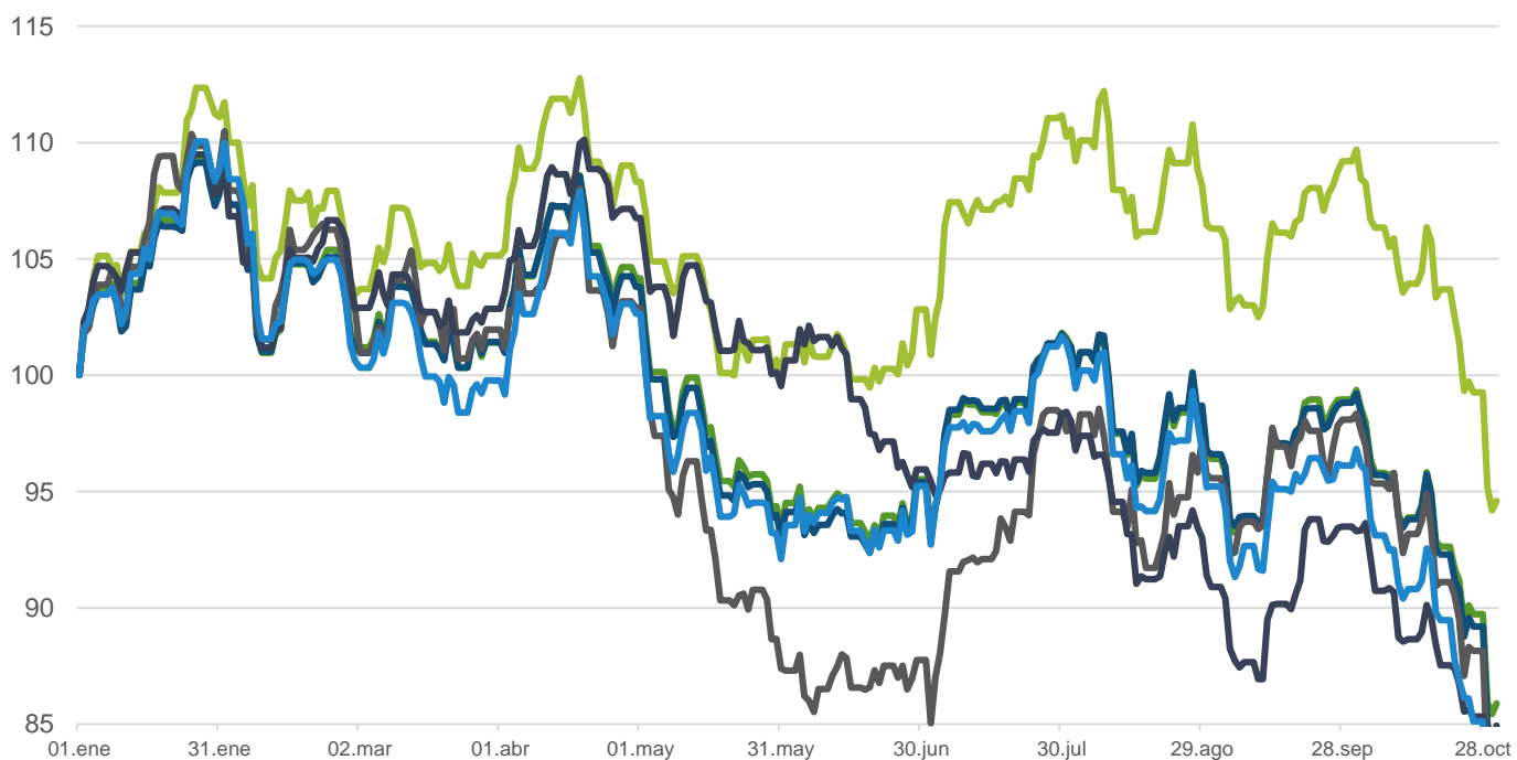
Desempeño Índices MILA S&P 2018 (base 100)